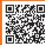
しもたかブック (下高井戸)