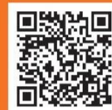
荻窪駅周辺地区 まちづくり構想