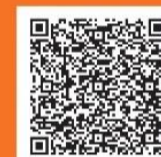
広尾五丁目 地区計画 (渋谷区)